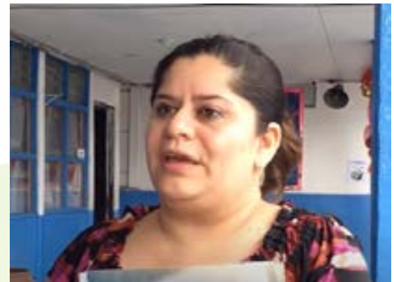
Testimonio de maestra y madre de estudiante (video):