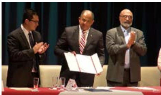
Presidente de Costa Rica (2014-2018), Luis Guillermo Solís Rivera