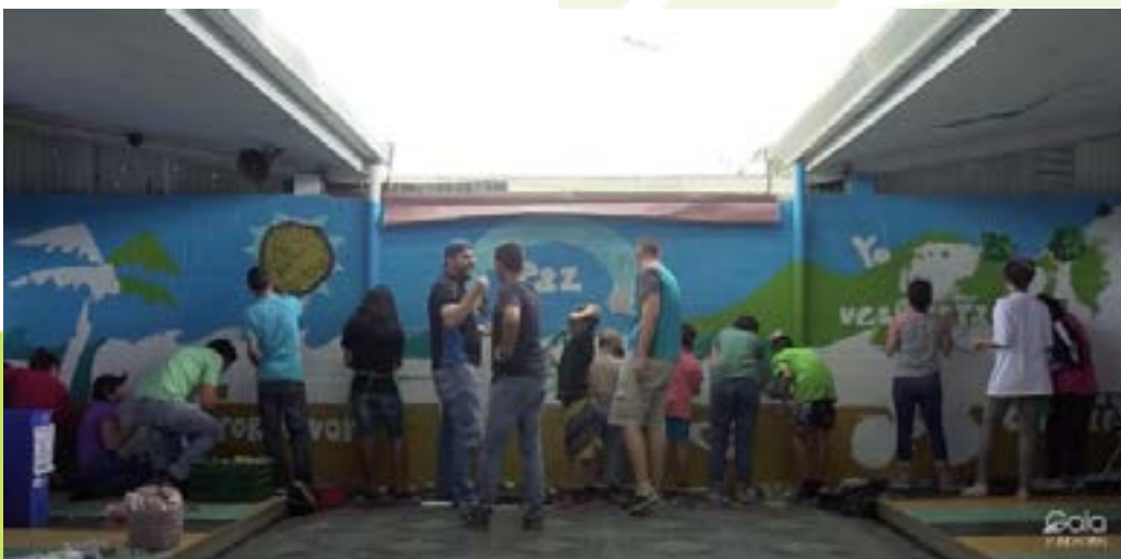
Creación de mural colaborativo (video):